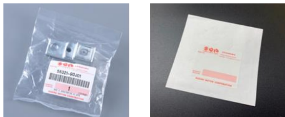
Emballage conventionnel (à gauche) et emballage papier (à droite) des pièces Suzuki Marine d'origine

SUZUKI FRANCE S.A.S 8, Avenue des Frères Lumière 78190 TRAPPES – France