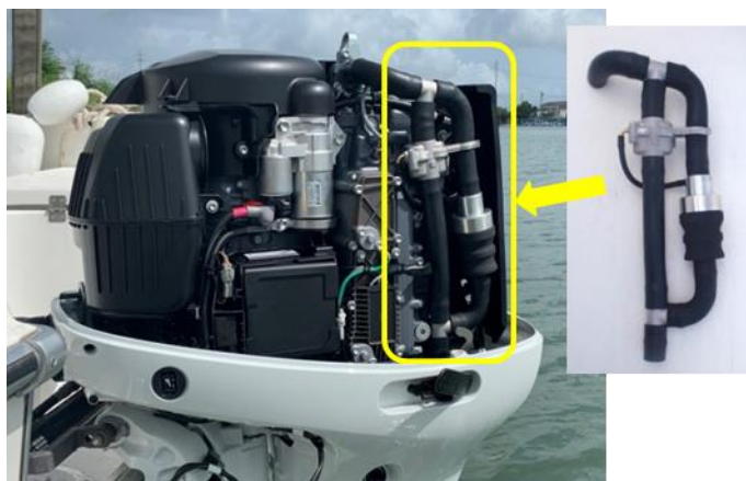
Moteur hors-bord équipé du dispositif de collecte de microplastiques

Lancement du « Suzuki Clean Ocean Project », une nouvelle initiative destinée à lutter contre la pollution plastique des océans