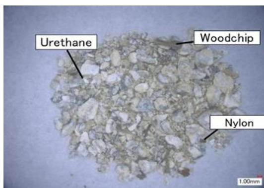
Déchets microplastiques réels collectés lors des études de suivi