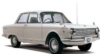
1965 Fronte 800